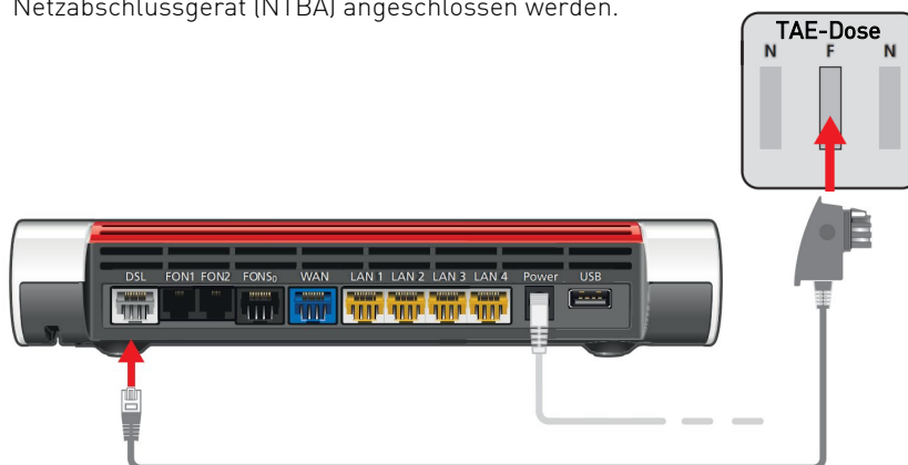
Verbindung mit dem DSL-Anschluss herstellen