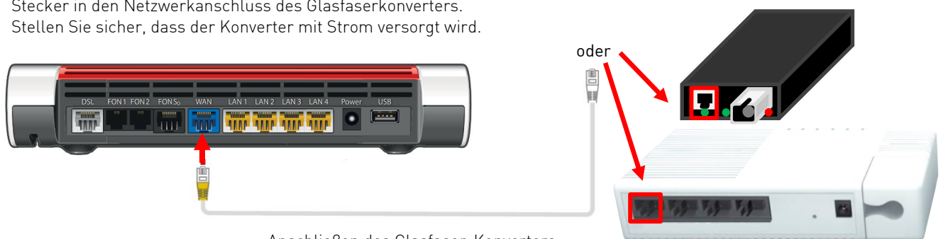
Anschließen des Glasfaser-Konverters