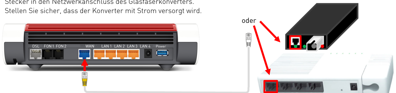
Anschließen des Glasfaser-Konverters