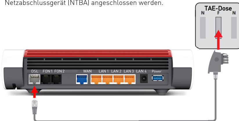
Verbindung mit dem DSL-Anschluss herstellen